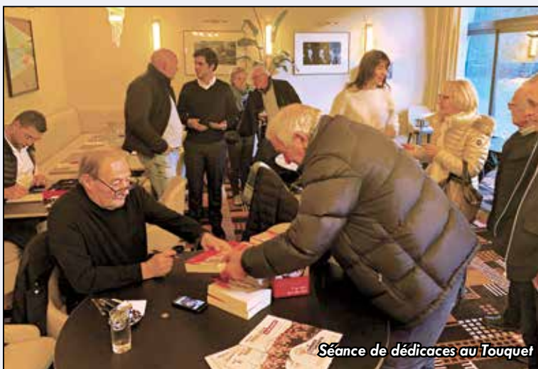
Séance de dédicaces au Touquet