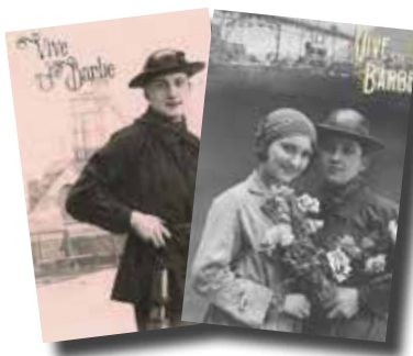
La carte postale de Sainte Barbe : 1€