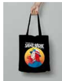
Le tote-bag du festival : 8€