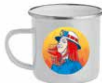
Le mug : 9€