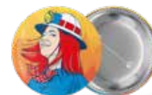
Le badge : gratuit

*L'abus d'alcool est dangereux pour la santé. A consommer avec modération.