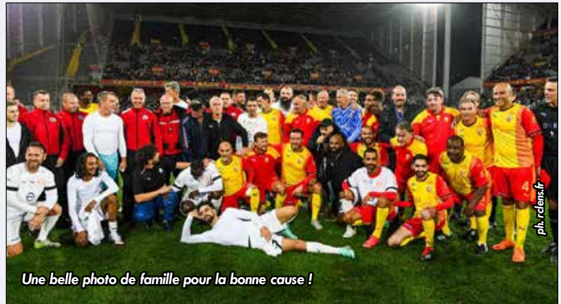
Une belle photo de famille pour la bonne cause !