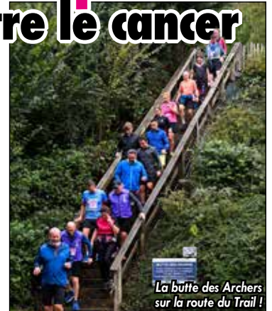
La butte des Archers sur la route du Trail !

Au total, plus de 5 000 € ont pu être collectés grâce aux différentes opérations (ventes de goodies) et animations menées dans la commune (cours de renforcement musculaire, lâcher