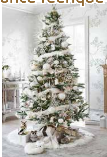
Table de Noël blanche, sapin de Noël enneigé, grande étoile lumineuse blanche, et même les emballages cadeaux sont blancs... Cette nuance décline sa sagesse dans les moindres détails. Une explication à ce béguin profond pour le blanc ? Nous sommes très nombreux à avoir plus que jamais envie de renouer avec la féerie et l'authenticité des fêtes. La transparence, l'innocence, la simplicité...

La présence du blanc vient renforcer cette sensation de retour en enfance, à ses contes féériques toujours bercés de paysages enneigés, cette pureté naïve et parfois nécessaire en ces derniers jours de 2023. Vive le blanc, vive le blanc ! ■