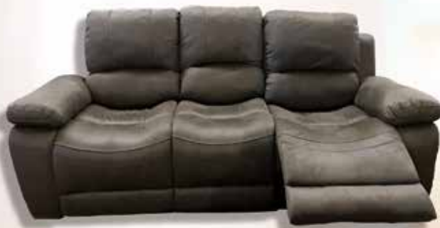
Canapé 3 places RILAX manuel - existe en 1 et 2 places