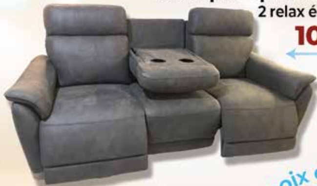
Canapé 3 places LEPERS 2 relax électriques + Bar